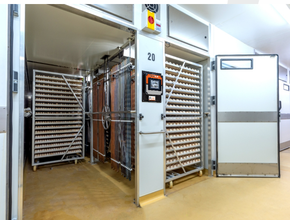
Un carro a cada lado del ventilador en ángulo recto con respecto al flujo de aire garantiza un entorno embrionario homogéneo.

Nuestras principales incubadoras y nacedoras de etapa única con una variedad de bandejas y capacidad hasta 162,432 huevos . Diseñado para plantas de incubación que requieren un control basado en PLC sofisticado junto con un rendimiento altamente eficiente. Equipado con nuestro principal control Eclipse™ basado en PLC que se puede operar manualmente o en modo completamente automático. Con un programa potente y flexible de 20 etapas, el usuario puede ajustar el proceso de incubación según sus requisitos.